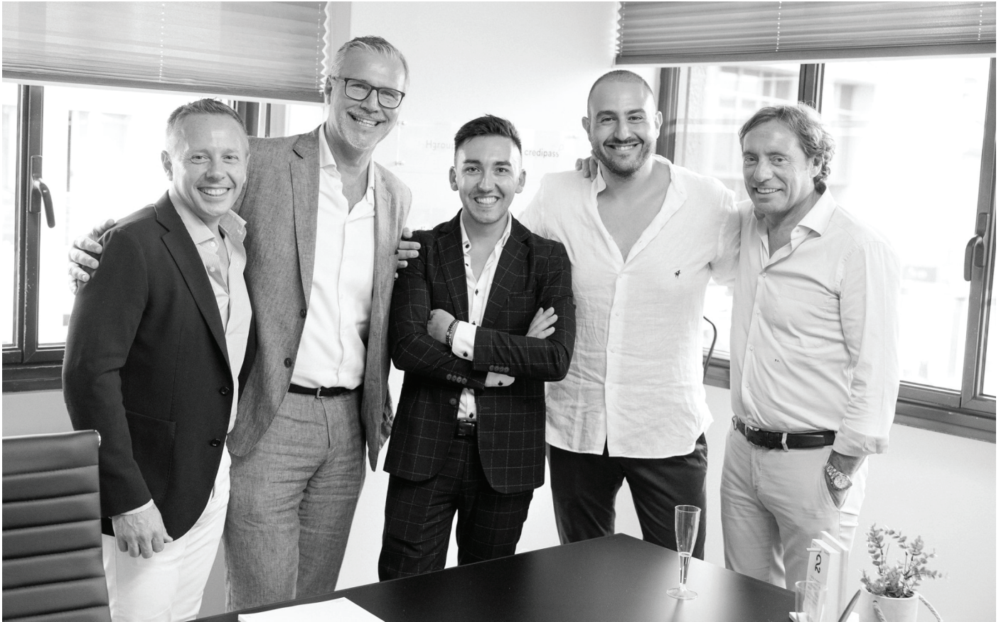
Inaugurazione della sede di Cagliari